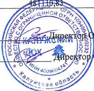
Чертёж выполнил _____ Директор ООО «Калужский Док» Савинов В.С.

Съёмку произвел _____ Директор ООО «Калужский Док» Савинов В.С.